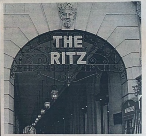
فندق «الريتز» اللندني