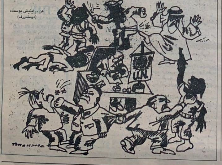
عن «اينيش بوست» (دوتلوروف)

ضخمة يمكن ان تتلعق انتاج أميركا واليابان معا، فأميركا لا ترعى عن الديمقراطية الصينية وحقوق الإنسان، وتهدد بعدم منح الصين حق الدولة الأولى بالرعاية، وتعرض على سياسات الصين النووية وتصدير السلاح، ولكنها لا تملك الا ان تشدد الحبل ثم ترخه فتوافق على حصول الصين على «السوبر كومبيوتر» وعلت التكنولوجيا المتقدمة في مجالات مفارضات الغات. تزداد أميركا اعتماداً في تجارتها على اسييا، وبالأخص مع اليابان والصين، ويحصد الأرقام والاحصائيات، فان أميركا توشك ان تولى وجهها شطر المحيط الهادي وتدير ظهرها للأطلنطي. وقد ساعدت نهاية الحرب الباردة على ذلك، ولولا العلاقات التاريخية والحضارية والتحالفات العسكرية مع أوروبا لكان التوجه الأميركي نحو اسييا أكثر قوة وحسماً. ومع ذلك، فلا يبدو ان علاقات أميركا تجاه اسييا تخلو من المتابع، ويكفي ان نرصد هذه الرقعة الأميركية مع الصين، هذا البلد العملاق الذي يحقق نمواً اقتصادياً يصل الي ٨٢٪ سنوياً، ويمثل سوقاً