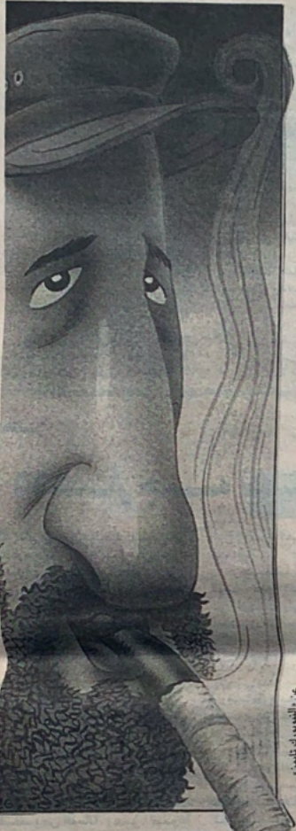
في الصورة: فيدل كاسترو

الاسواق. ● خلق منظمة تجارية متعددة الأطراف. لكن هناك تحركات جرت في اللحظة الاخيرة تشير الى امكانية التقدم في المسألة الزراعية، وهي الاعتدق بين السائل. وقد ساعد على ذلك تخفيف الرئيس الاميركي من اهتمامه بالشؤون الاقليمية وتركيزه على الشؤون العالمية بالتنسبة للتجارة. ومع ذلك فان الفرنسيين يرون ان التحرك على الصعيد الزراعي ليس كافيا، بل يجب ان يكون هناك تحرك سريع على جبهات اخرى كاصحاب التسعيع والقواعد التي تخضع اميركا للممارسات المعول بها لدى الدول الاخرى في المستقبل. ويقول الفرنسيون انهم لم يحصلوا على اي شيء، بعد.