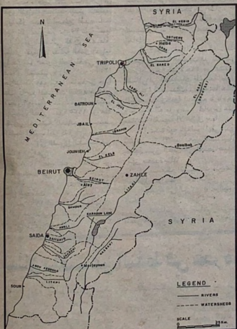
الرسم البياني ١- خريطة مساطل المياه

ان الموارد المائية المتوفرة في لبنان تظهر عدم التوازن حسب الموسم. فمن اثنى الا شهر ايار/مايو حتى اذار/مارس هناك ثلاثة ايام فقط تجري على مدار السنة Perennial منها: الشهر الكبري الذي يشكل الحد الفاصل الشمالي بين لبنان وسوريا، ونهر العاصي الذي يتجه صوب سوريا، ونهر الحاصباني الذي يتجه صوب فلسطين، ويظهر الرسم البياني رقم ١ خريطة لتوزيع الانهر وأحواضها.